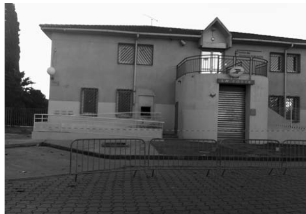
Le distributeur de billets, cible de l'attentat