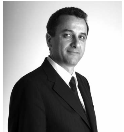
François Tatti, Président du Groupe Gauche Républicaine à l'Assemblée de Corse

«Les élus du groupe Gauche Républicaine à l'Assemblée de Corse réagissent à la décision du Conseil Constitutionnel censurant la prorogation des dispositions dérogatoires sur les droits de succession en Corse. S'il est incontestable que rien ne justifie que les droits de succession acquittés en Corse soient durablement différents des droits portant sur des biens immobiliers situés sur le continent, la brutalité de la décision du Conseil Constitutionnel plonge la Corse dans une situation inacceptable. En effet, nonobstant le travail considérable du GIRTEC sur l'établissement des titres de propriété, le nombre encore significatif des indivisions justifie pleinement le report de 5 ans prévu par la disposition de la loi de finances censurée par le Conseil Constitutionnel. Le groupe Gauche Républicaine ne doute pas que le gouvernement mettra tout en œuvre pour faire adopter un nouveau texte qui, à l'instar de ce qu'il a annoncé pour d'autres dispositions fiscales censurées, rétablira la mesure et permettra à la Corse de préparer sereinement la sortie de cette mesure dérogatoire.»