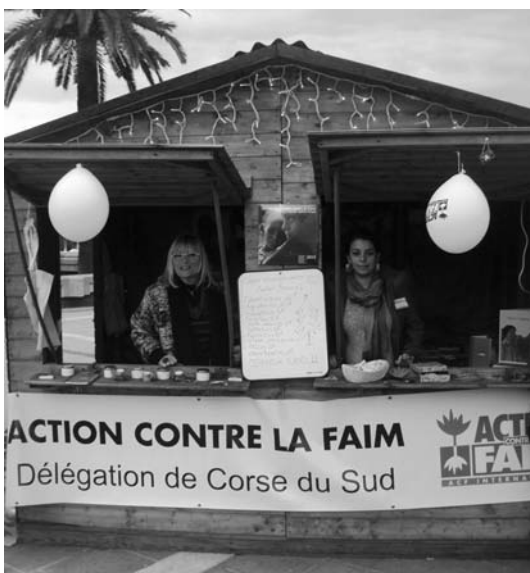
Sur le marché de Noël d'Ajaccio, en décembre 2012

La délégation de Corse du Sud d'Action Contre la Faim a encore sa pierre à apporter à l'édifice. Une pierre que l'on espère la plus grande possible.